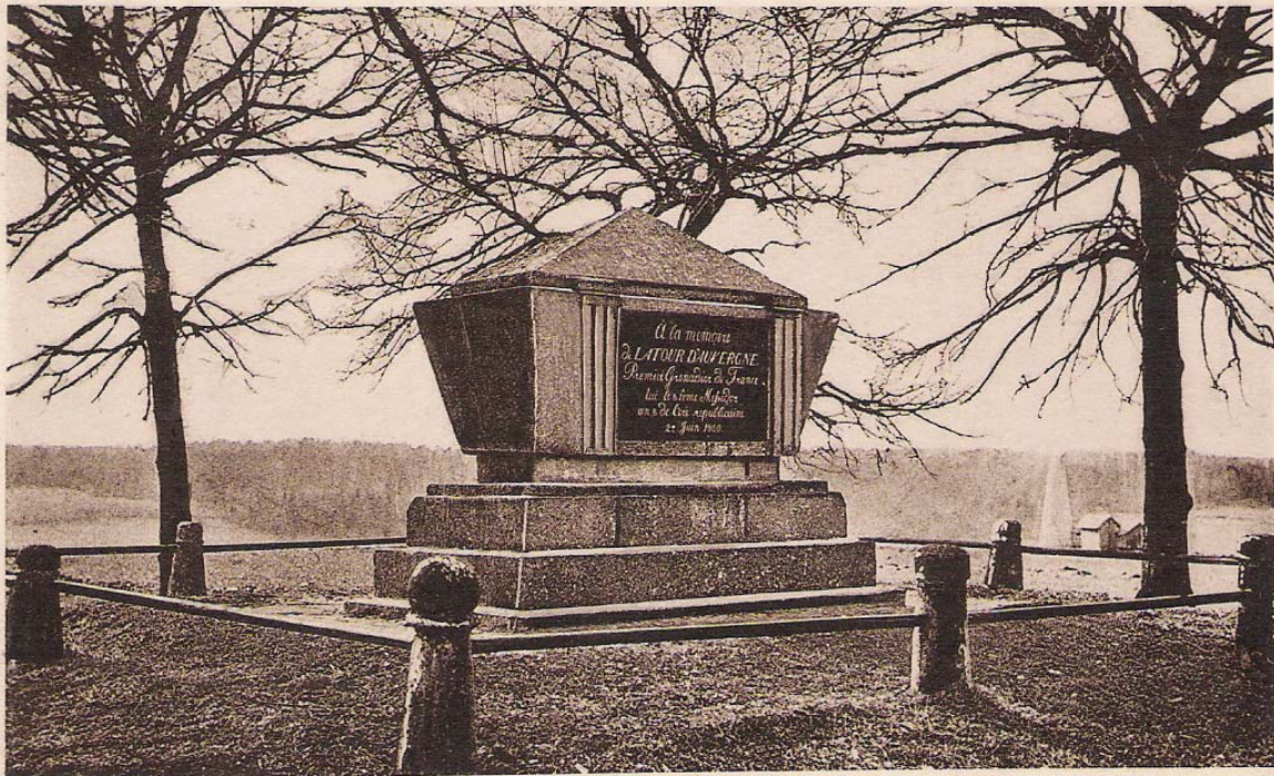
Denkmal des Latour d'Auvergne bei Oberhausen