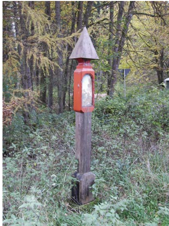
Die Rote Säule

Zwischen Unterhausen und Sinning steht die Rote Säule. Da ist ein Hirsch mit dem Kreuz zwischen dem Geweih und ein Jäger draufgemalt. Die Leute haben sich früher erzählt, daß da im Wald zwischen Sinning und Unterhausen ein Hirsch umeinanderläuft, der zwischen dem Geweih ein goldenes Kreuz trägt. Ein Jäger hat das nicht glauben wollen. Dann ist er nachts auf die Jagd gegangen, und plötzlich ist ein Hirsch vor ihm gestanden. Er hat draufgeschossen: der Hirsch ist aber nicht tot umgefallen. Da hat sich der Jäger hinge kniet und ist gläubig geworden. (Emmi Böck: Sagen aus dem Neuburg-Schrobenhauser Land, Nr. 277)